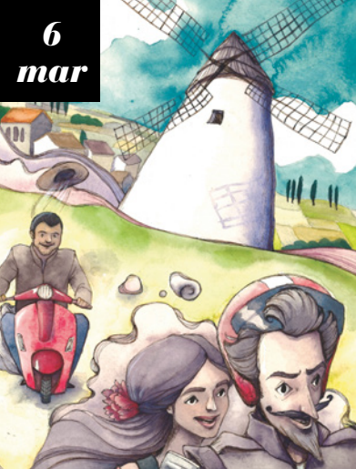
Illustration: Diala Brisly