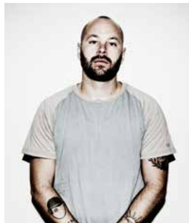
Regi & skådespelare: Ulf Stenberg